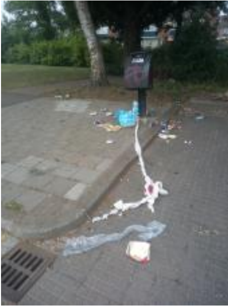
Parkeerplaats Aldi op 2 augustus 2020

Van den Tweel is sinds 2019 eigenaar van winkelcentrum Paasbos. Over de overlast meldt hij: "Ik weet dat er veel overlast is. Zowel onze vastgoedbeheerder als de technische dienst gaan regelmatig kijken. Zelf rijd ik minimaal twee keer per week langs het terrein om er een oogje in het zeil te houden. Wij zullen onze huurders hierover nogmaals informeren. Goed dat er een mail is gestuurd naar de gemeente!"